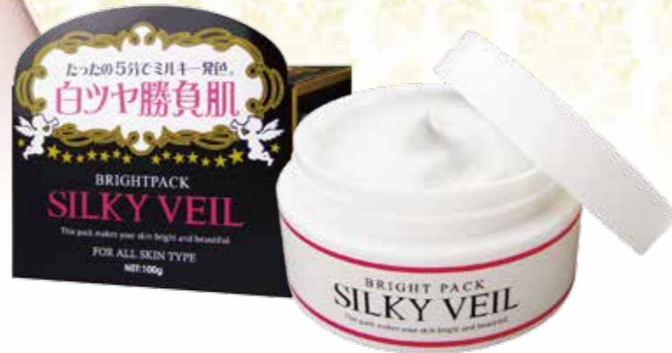
丝奇 美白面膜 NET.100g JPY 1,900

仅仅5分钟可以瞬间美白 脸部、胳膊、腿、脖子等全身都可以使用、自然美白。使用的成分「富勒烯」和「EGF」不仅在皮肤表面，也从身体的内侧开始慢慢变白。同时还配合胶原蛋白、玻尿酸等美容成分，除了使皮肤变白之外，也有美肤的效果。