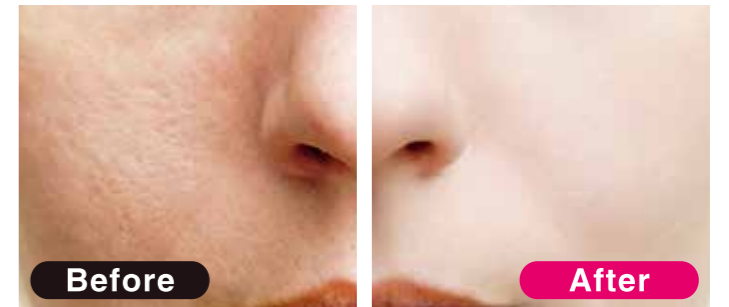
NET.25g JPY 3,800

很多女性为了遮盖毛孔、小细纹、皮肤的凹凸不平等，经常使用厚厚的粉底霜和打底霜。不仅没有达到遮盖的效果，反而看上去很不自然。本产品只需要少量就可以将毛孔、皱纹等遮盖住，并且长时间保持妆容。